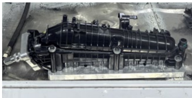
Le contrôle qualité est effectué sur des bancs d'essai spécialement conçus à cet effet.